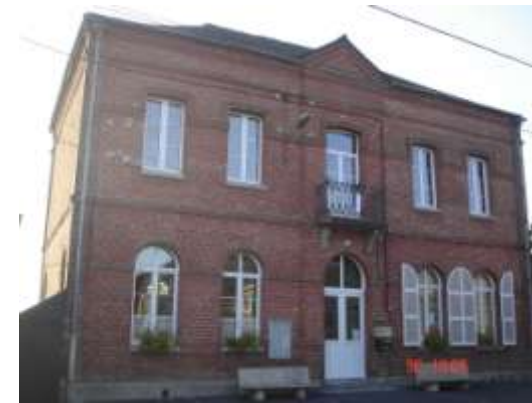
Mairie Ecole de Monceau sur Oise

Nous y sommes !, second numéro de ce bulletin municipal, sous sa forme définitive.