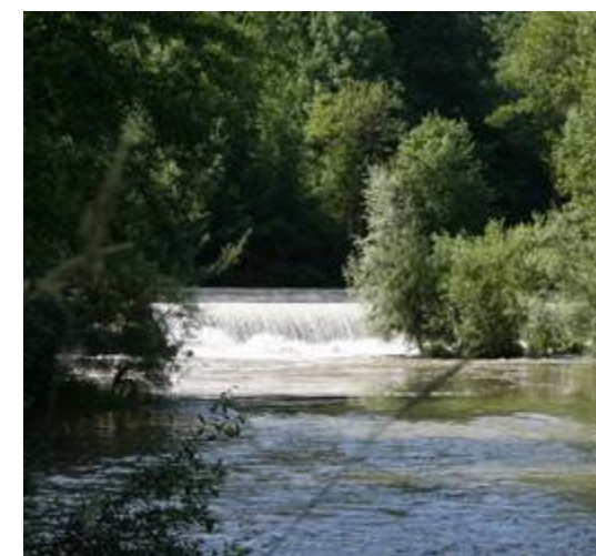
BARRAGE EN AMONT DE LA MICRO CENTRALE

Permettez-moi de vous souhaiter à tous d'agréables congés d'été 2009.